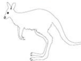
— Marsupiali —