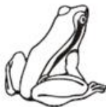
— Anfibi —