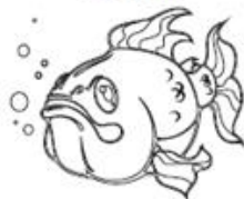
— Pesci —