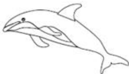
— Cetacei —