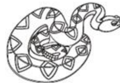
— Rettili —