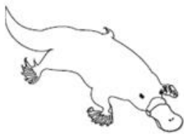
— Monotremi —