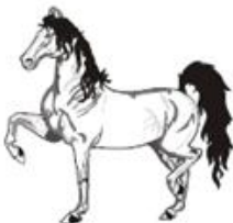
— Placentati —