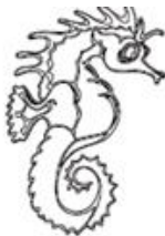
— Pesci —