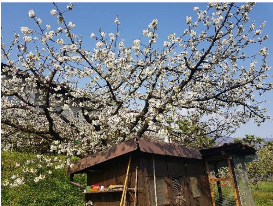
La foto mostra un albero di ciliegio nel suo splendore fiorito.