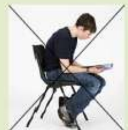
«E nemmeno così!»