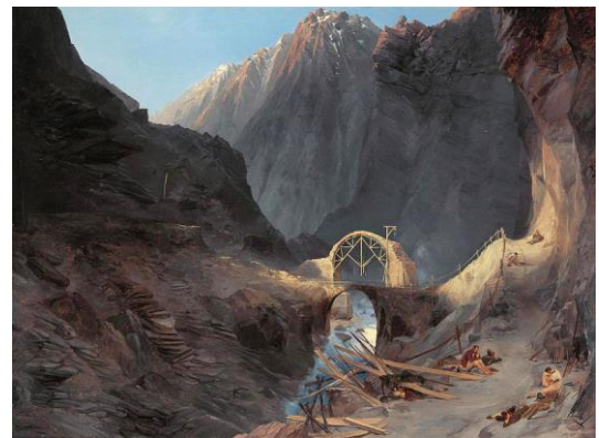
La costruzione del ponte del Diavolo, opera di Carl Blechen, c. 1833 presso la Neue Pinakothek di Monaco.

Nel 1273 Rodolfo d'Asburgo fu eletto Imperatore. A quel punto le comunità montane della Svizzera centrale che avevano tanto lottato per liberarsi dall'oppressiva tutela degli Asburgo, si ritrovarono ad essere di nuovo assoggettati alla sempre più potente casa austriaca. Rodolfo voleva inoltre ristabilire la dominazione diretta su queste importanti terre. Reso accessibile all'inizio del XIII secolo con la costruzione del primo ponte sopra la Reuss, nella gola della Schöllenen (chiamato ponte del diavolo ) e con la passerella sospesa alla viva roccia, che permetteva l'accesso al ponte, il passo del Gottardo aveva infatti acquisito importanza europea.